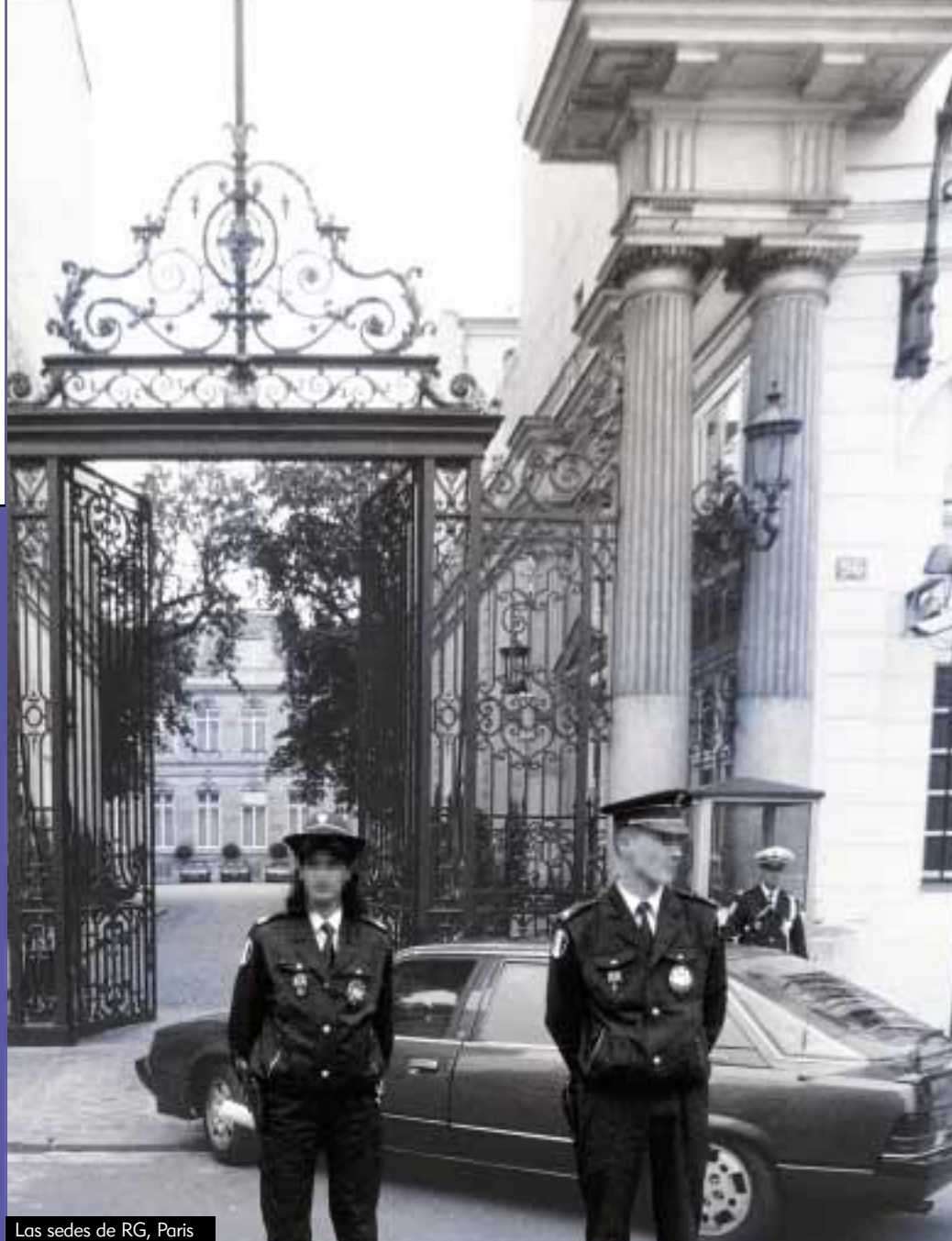
Las sedes de RG, Paris

El Renseignement Generaux (RG) de Francia, tiene archivos en por lo menos 500,000 individuos, informa un antiguo jefe de RG, en su libro RG: La máquina de escándalo: "Además, sin ninguna duda son el número uno de otros en los que RG ha reunido información, legal o ilegalmente" .