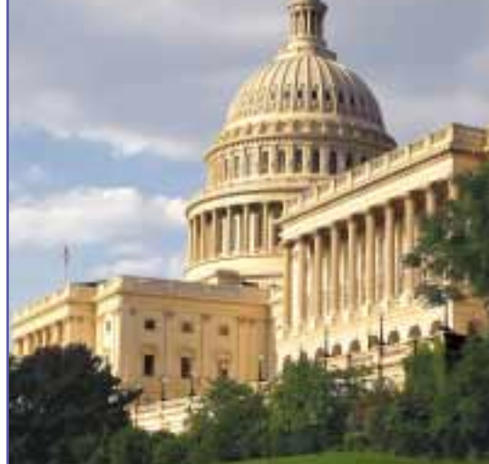
El Congreso de los EEUU

Al principio de la década de 1980, las investigaciones de la iglesia obtuvieron documentos bajo el Acta de Libertad de Información de EE. UU. que describe cómo la CIA, con la cooperación del personal del ejército de EE. UU., secretamente realizaron tests biológicos en el sistema de metro de Nueva York en 1966.