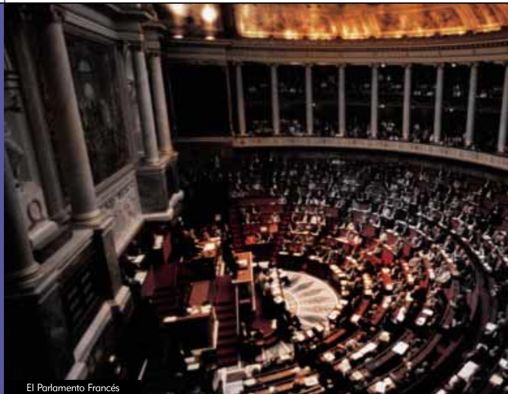
El Parlamento Francés

Unas leyes modernas en Francia establecen nuevas libertades públicas. La ley del 17 de julio de 2004 es extraordinaria en el punto de que establece un cimiento muy vital para la conducta del gobierno: la transparencia de servicio público.