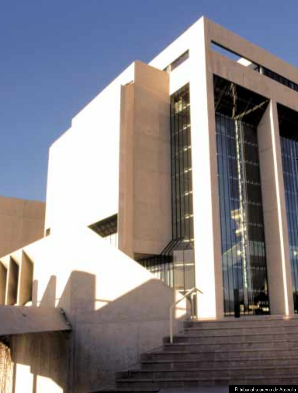
El tribunal supremo de Australia

Los científicos han desempeñado un papel vital en ayudar a los legisladores canadienses (página de frente) a adoptar leyes de libertad de información.