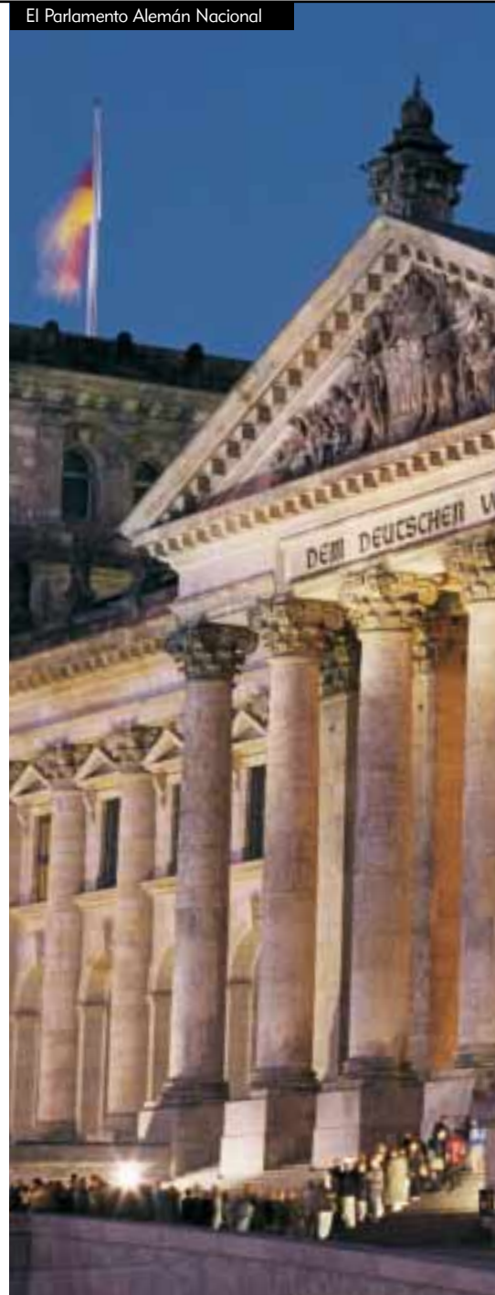
El Parlamento Alemán Nacional

Alemania tiene varias leyes que permiten a los individuos inspeccionar los archivos del gobierno que contienen datos personales sobre sí mismos. Pero hasta 1998, Alemania no tenía legislación de libertad de información, que por sí sólo permite a cualquier ciudadano interesado inspeccionar los registros sobre las actividades de sus gobiernos y así iluminar áreas de corrupción potencial. Después de su experiencia con el régimen dictatorial del Este de Alemania, algunos de los estados del este de Alemania adoptaron medidas de libertad de información en sus constituciones. Pero esos derechos no generaron uso práctico para ciudadanos ya que su redacción era imprecisa y no