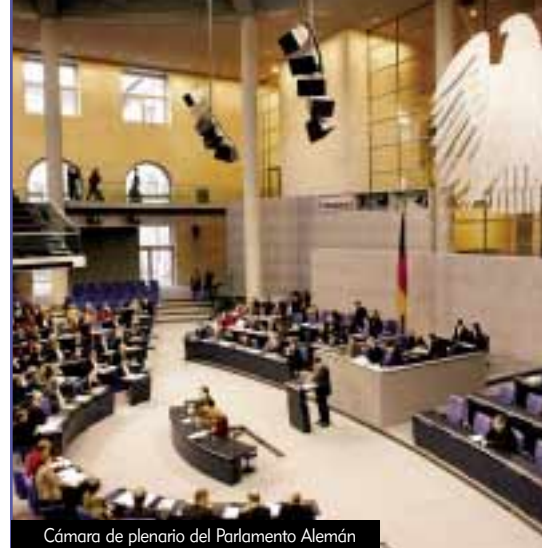
Cámara de plenario del Parlamento Alemán

El parlamento alemán federal aún tiene que promulgar la legislación de libertad de información, una causa avanzada por una gran variedad de seguidores del gobierno, incluyendo la Iglesia de Cienciología de Alemania.